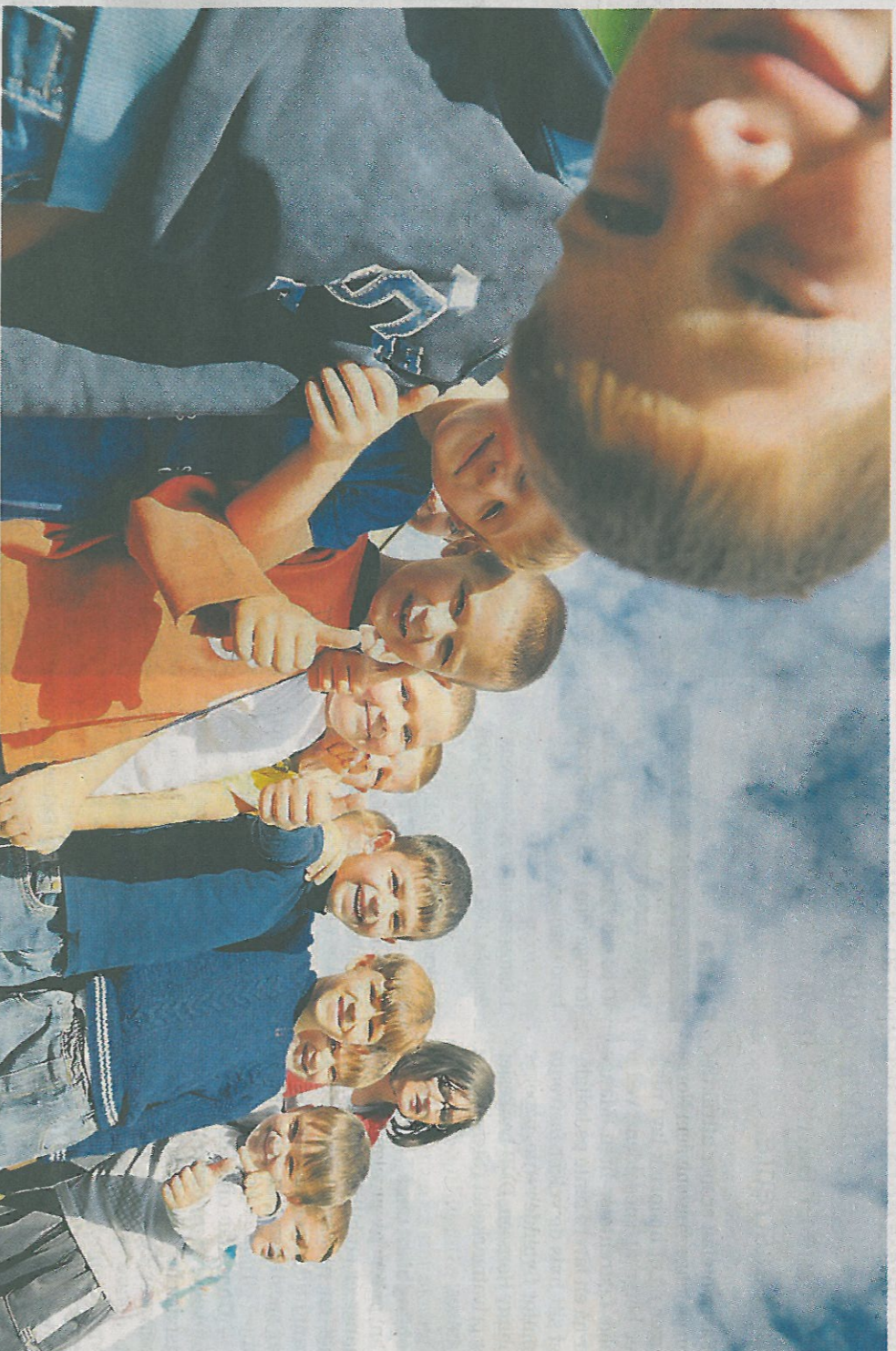
Viktig: DUÅs barnehagetiltak bidrar til kompetanseheving og økt kvalitet i barnehagene og fremmer barns danning. Vi tror at tidlig innsats og styrking av universalforebyggende tilbud i kommunene sikrer at flere barn får tidlig og tilpasset hjelp via sine ordinære dagtilbud, skriver kronikørerne.

I mange barnehager i Verdal og Levanger benyttes Skole- og barnehageprogrammet og Dinosaurskole i klasserom, SFO og barnehage. Disse programmene er universalforebyggende og spesielt tilrettelagt for bruk i barnehage og skole. De ansatte blir presentert for ulike tilnæringsmåter som gjennom forskning har vist god nytteverdi for barns læring og utvikling. Tilnæringsmåtene er forankret i DUÅs teorigrunnlag, som er relasjons- og tilknytnings teori, sosial lærings teori, kunnskap om gruppeprosesser og kunnskap om barns utvikling. Mye av tematikken i programmene er